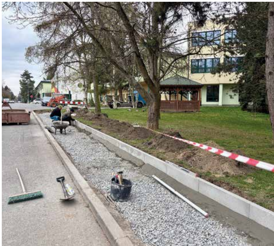
Stavba nového chodníku

Nový chodník vznikl v úseku, kde se dosud chodci pohybovali převážně po vozovce nebo nezpevněném okraji komunikace. To bylo zejména v ranních a odpoledních hodinách rizikové, a to nejen pro dospělé, ale především pro děti směřující do školy či na kroužky. Vybudováním souvislé a bezpečné trasy se podařilo tento problém výrazně zmírnit.