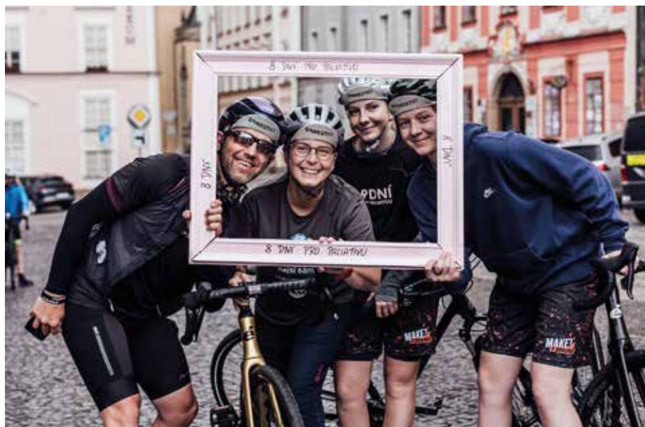
Účastníci předchozích ročníků akce

Tohle není akce, kterou jen minete. Je to příležitost být součástí něčeho, co má skutečný smysl. Podpoříte hospicovou