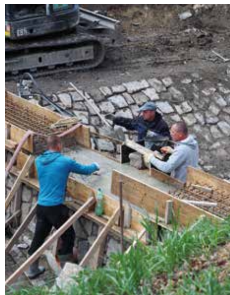
Práce na přehrážce Zelenečského potoka

Práce jsou načasovány tak, aby probíhaly v období s nižšími průtoky vody