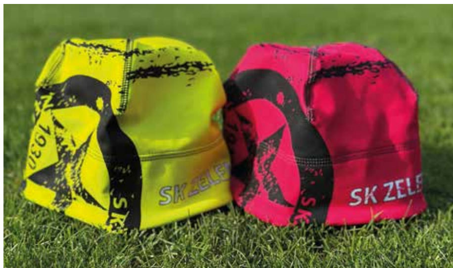
Nezbytná výbava všech fanoušků i hráčů SK Zeleněč