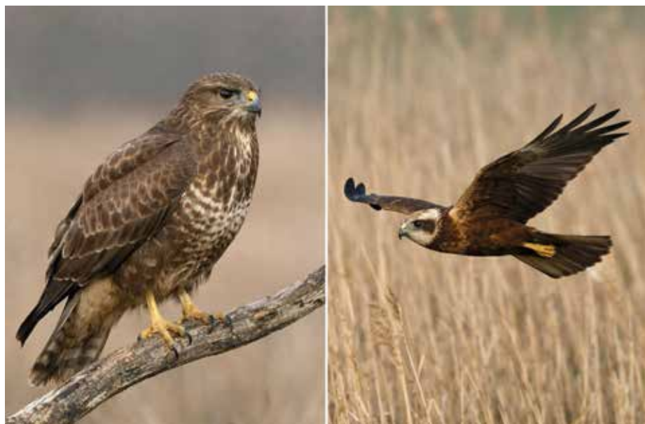
Vlevo samec luňáka červeného, vpravo samec motáka pochopa