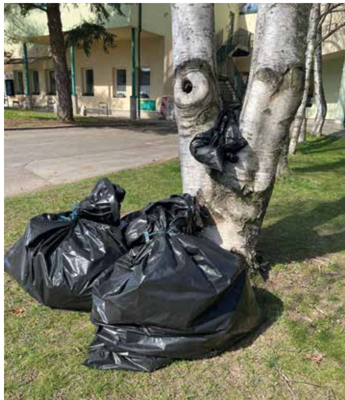
Připravené pytle odpadků ke svozu

Stejně jako každý rok nás potěšil zájem obyvatel o své okolí. Bohužel nepořádku je kolem nás stále hodně, a to i velkých kusů, které ničí přírodu. Díky společnému úsilí jsou zejména okrajové části obce opět o něco čistší a příjemnější. Čistota obce ale není jen o jednorázových akcích - je na každém z nás, jak se k okolí chováme každý den. Odpad má své místo v koších a popelnicích, a právě tento základní návyk má smysl předávat dál.