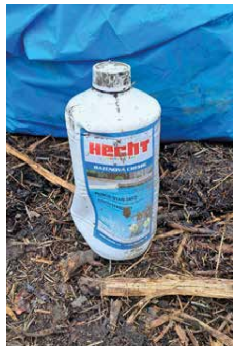
Nález, který do bio odpadu nepatří