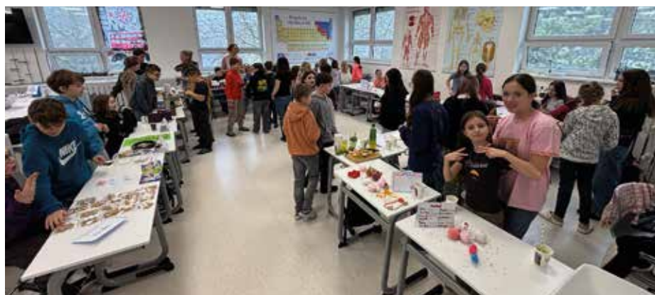
Anglický trh se vždy těší hojně účasti