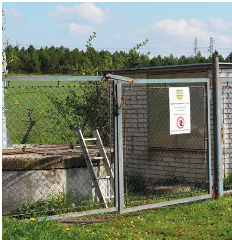
Současná čerpací stanice odpadních vod v ul. Olšová

Původní výběrové řízení bylo řádně ukončeno a měli jsme i vybraného dodavatele. Krátce poté se ale ukázalo, že společnost S-Power Business Solutions, s.r.o. není schopna dostát svým závazkům a následně skončila v insolvenční.