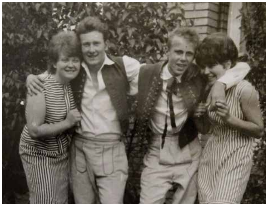
Mládenci a nevěsty, pravděpodobně rok 1963