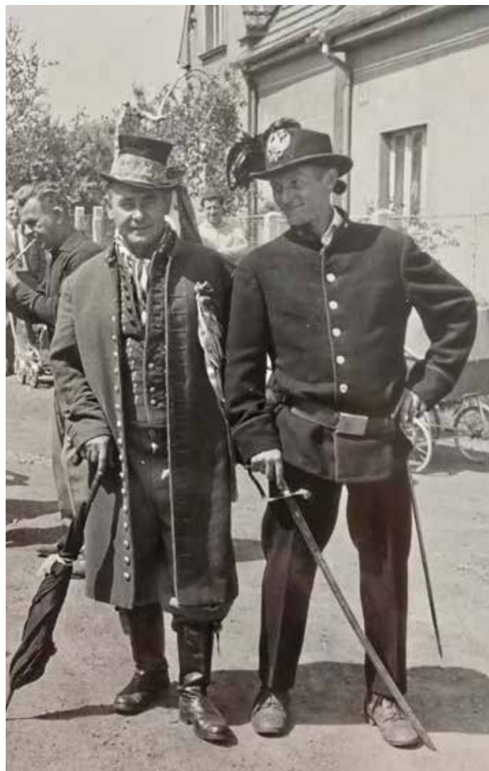
Kecal a policajt pravděpodobně rok 1963