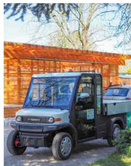
Jeden ze tří elektromobilů obce