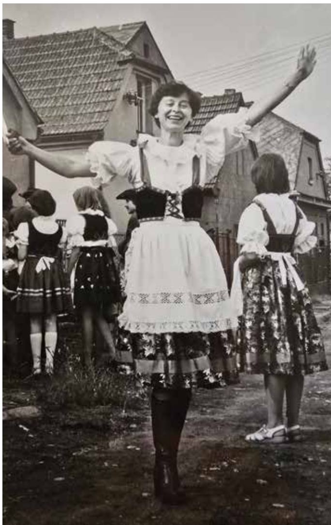
Selka, rok 1978

Srdcem celého průvodu jsou selky. V pestrých krojích přinášejí do průvodu barvy, pestrost, půvab a něhu. Nejčastěji mají červené sukně z plátna nebo brokátu zdobené vyšívánými či jednobarvnými stuhami. K nim patří bílá zástěra a bolerko sešněrované vyšívanou stuhou, pod níž je bílá halena s balónovými rukávy a krajkovým volánkem u krku. Nejmladší děvčátka mají často ve vlasech věnečky z vličních máků, kopretin a chrp, často doplněné zlatým klasem