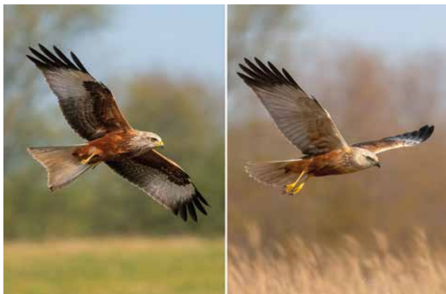
Vlevo samec luňáka červeného, vpravo samec motáka pochopa

Kulturní krajina, ve které se pohybujeme, je společným prostorem člověka i volně žijících živočichů. Druhy jako moták pochop nebo čejka chocholatá jsou toho dobrým příkladem – dokázaly se přizpůsobit, ale zároveň se tím dostaly do většího kontaktu s lidskou činností. O to důležitější je vnímat jejich přítomnost a respektovat signály, které nám dávají. Stačí přitom málo – všímavost, ohleduplnost a ochota udělat pár kroků jinam. V jejich světě to může znamenat rozdíl mezi úspěšným vyvedením mláďat a ztrátou celé generace.