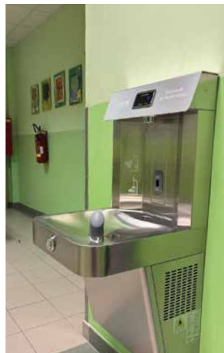
Nový výdejník filtrované vody

Možná je to jen drobná změna. A přesto věříme, že právě takové kroky pomáhají vytvářet prostředí, kde se děti nejen učí, ale kde se také dobře cítí a postupně si osvojují návyky, které si ponесou dál.