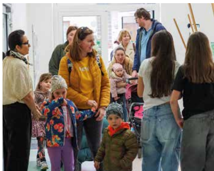
Návštěvníci akce při příchodu do školy