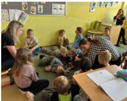
Žáci s učiteli během čtení v rámci Dne s Andersenem

Každá třída k tématu přistoupila trochu jinak, a přesto bylo od začátku zřejmé, že všechny spojuje jeden společný zájem. Přivést děti ke čtení jako k něčemu, co má smysl, co může být radostí i objevováním. Zároveň tato akce přirozeně navazuje na naše dlouhodobé aktivity v oblasti rozvoje čtenářství a pisatelství, ke kterým se hlásíme i díky zapojení do projektu Pomáháme školám k úspěchu.