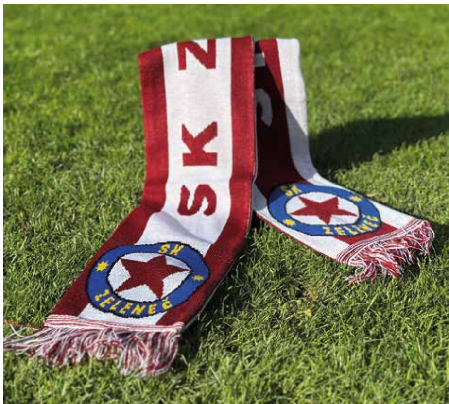
Nezbytná výbava všech fanoušků i hráčů SK Zeleněč

V zimních měsících je situace ještě složitější. Velké hřiště není možné využívat a tréninky se přesouvají na malé plochy nebo do okolních obcí. To znamená nejen více financí z klubu, které by se jistě daly investovat efektivněji do vybavení pro děti i starší hráče, ale hlavně značnou zátěž pro rodiče, kteří musí děti pravidelně převážet. Navíc ani tato řešení nejsou dlouhodobě udržitelná –