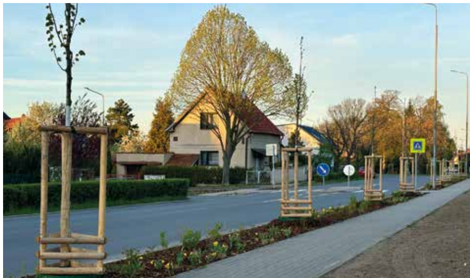
Nová výsadba v Zelenči

historicky řezány tzv. řezem na hlavu, která dost podstatně zkracuje životnost. Takže jde sice o mladé stromy, ale na pařezu už vidíte hniloby, praskliny větví. Proto tyto stromy odstraníme a nahradíme novými, které nám budou připraveny poskytnout větší ekosystémové služby. To znamená, že stromová korunka nebude tak maličká jako doteď, strom pokvete, na podzim bude mít barevné listy, bude produkovat více kyslíku, bude schopen poutat více prachu a hluku. Zkrátka půjde o jiný typ zeleně.