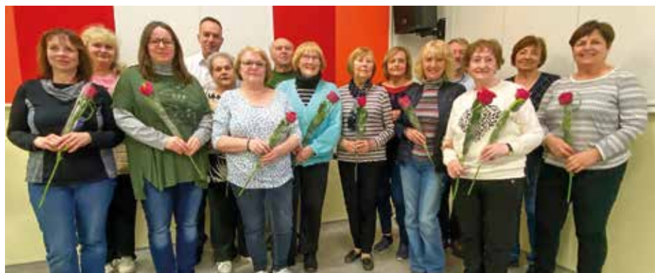
Absolventi Zelenečské akademie třetího věku se starostou obce

Největší sláva ale začala po skončení přednášky. Třináct prvních absolventů akademie totiž převzalo z rukou starosty a koordinátora diplomy, květiny a malé dárečky. 12 dam a jeden pán se nesmazatelně zapsalo do historie zelenečského vzdělávání určeného dříve narozeným. Atmosféra v komunitním prostoru byla důstojná a dojemná.