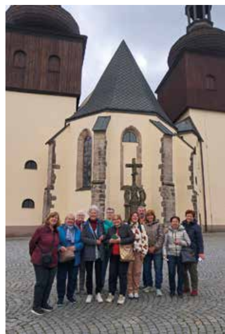
Skupina výletníků na Masarykově náměstí v Náchodě

Na zpáteční cestě čekala na účastníky zájezdu zastávka v Náchodě s návštěvou pramene minerální vody Ida. Tento historický pramen je spojen s místní tradicí a připomíná zajímavé příběhy z minulosti. Prostor byl i k individuální prohlídce města, včetně Masarykova náměstí a jeho okolí, které patří k významným dominantám Náchoda.